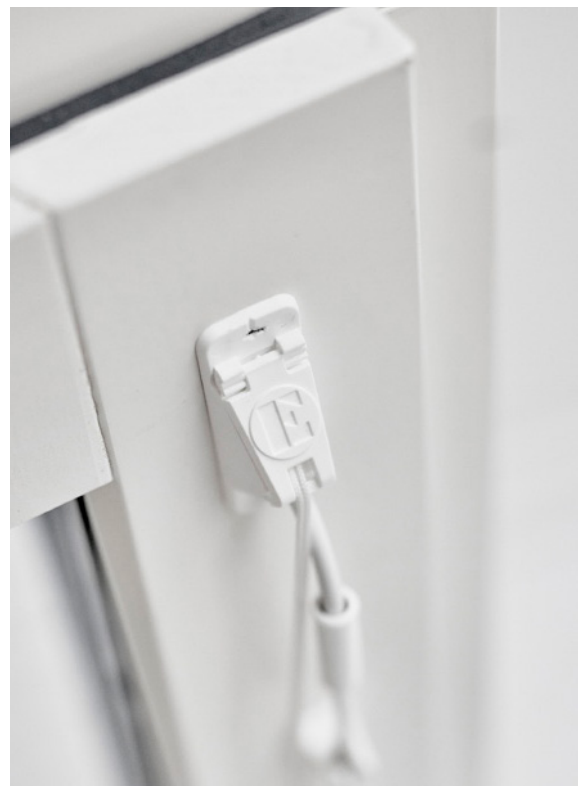
Detaljbild på Elitfönsters patenterade snörledare.